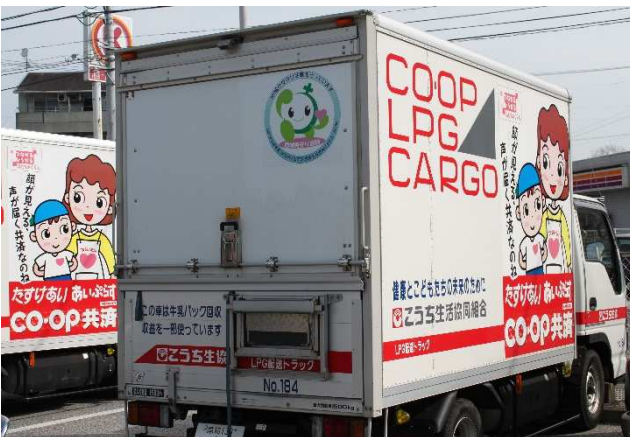
▲ 地域見守り活動【こうち生協】