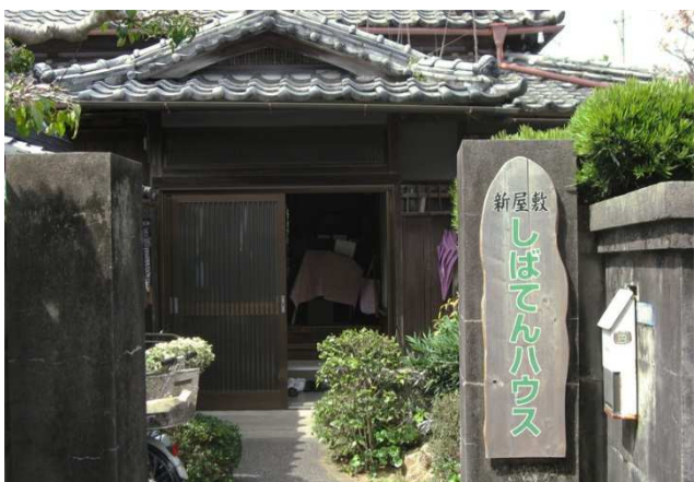
▲ 宅老所「新屋敷しぼてんハウス」【高知県高齢者福祉生協】