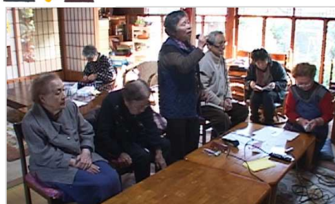
カラオケ【高齢者福祉生協】