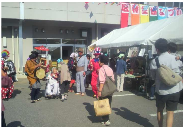
▲ 虹の健康フェスタ【高知医療生協】