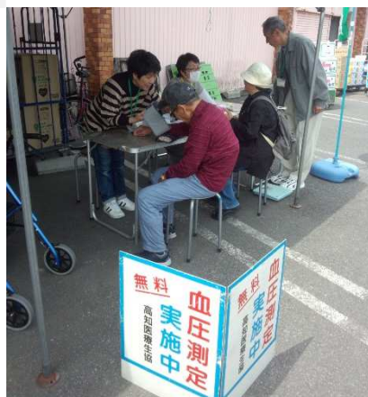
▲ 青空チェック【高知医療生協】