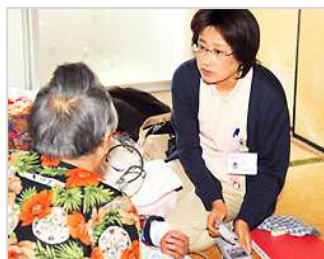
▲ 訪問看護【高知医療生協】

■アットホームなデイサービスです。楽しくお話し、食事をしたり健康体操に汗を流したり利用者の意志や思いを尊重し支援します。