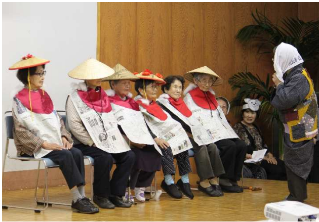
▲ 組合員のついで【高知県高齢者福祉生協】