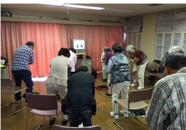
▲ 百歳体操【高知医療生協】