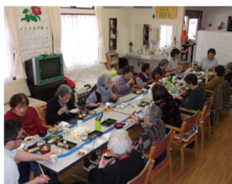
▲ デイサービスやまもも【高知医療生協】