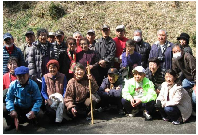
▲ 山旅くらぶ【高知県高齢者福祉生協】