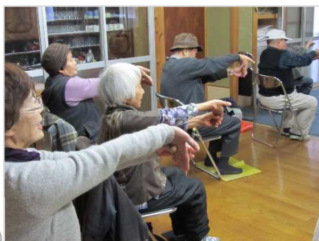
百歳体操【医療生協】