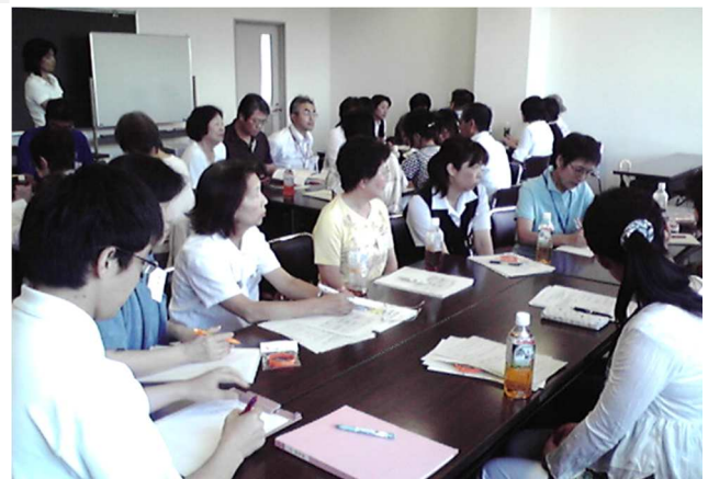
▲ 認知症サポート研修【高知県生協連合会】