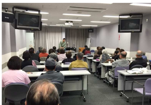
▲ 健康ひろば あさひまち(サロン)【高知医療生協】