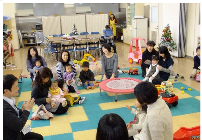
▲ 子育て広場【こうち生協】