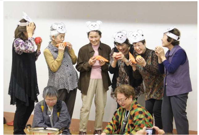
▲ 組合員のついで【高知県高齢者福祉生協】