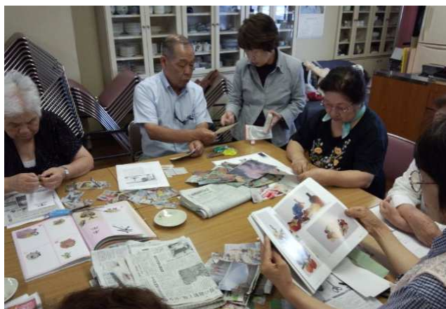
▲ ちぎり絵【高知医療生協】