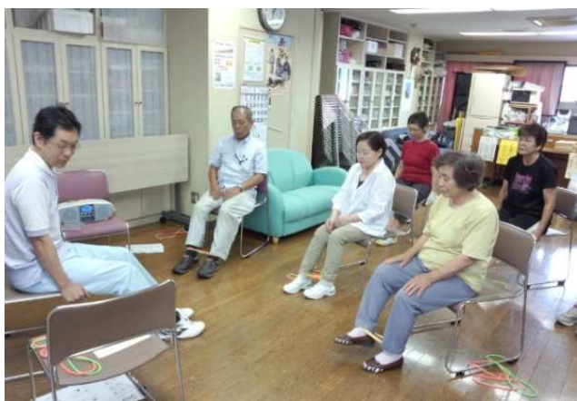
▲ ループ体操【高知医療生協】