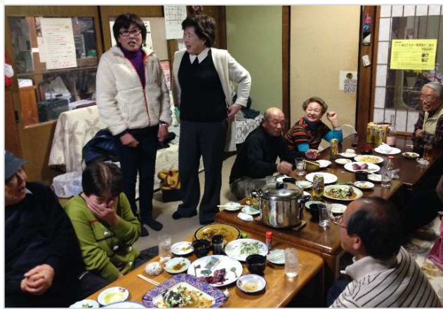
▲ 四金の会【高知県高齢者福祉生協】