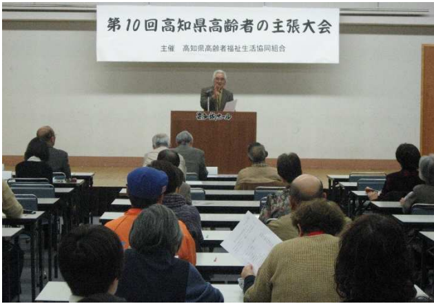
▲ 高知県高齢者の主張大会【高知県高齢者福祉生協】