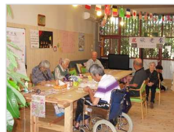
▲ デイサービス【高知県高齢者福祉生協】