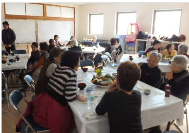
▲ ついで活動【こうち生協】